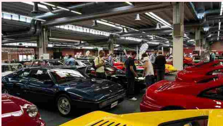
Un momento della mostramercaato dello scorso anno